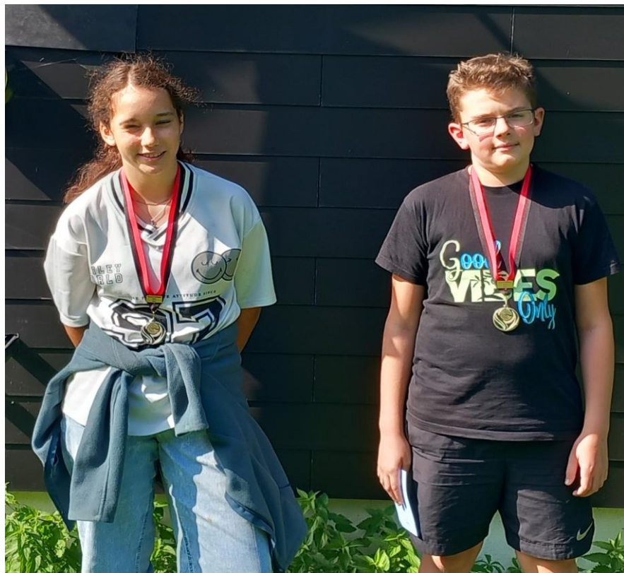
Posest Kategorie II